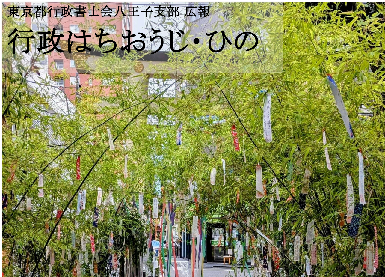
撮影場所：子安神社